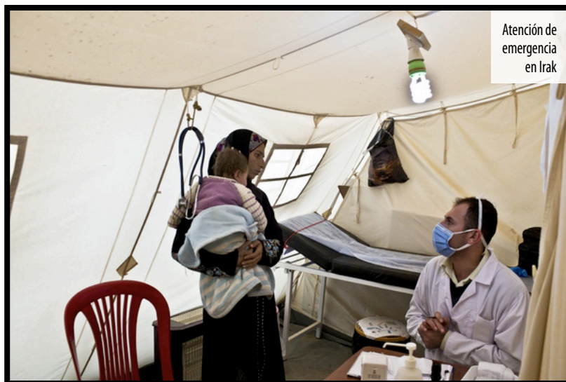
Atención de emergencia en Irak