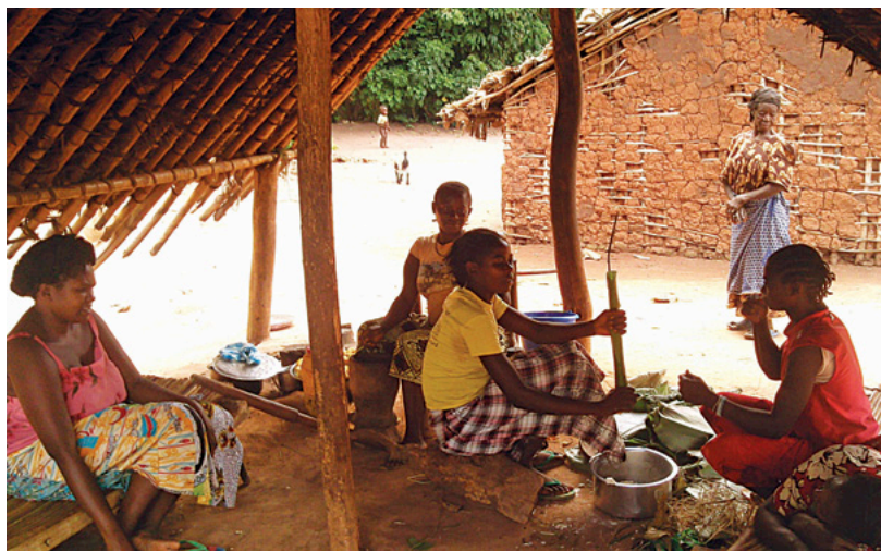
El momento de los alimentos durante la misión humanitaria

Llegamos a Kampala, pero debido a que la compañía aérea que nos transportaba de Kampala hacia el Congo se encontraba fuera de circulación por mantenimiento a sus aviones, había un número reducido de plazas para volar y le dimos prioridad al equipo logístico que debía llegar y montar el hospital donde íbamos a laborar.