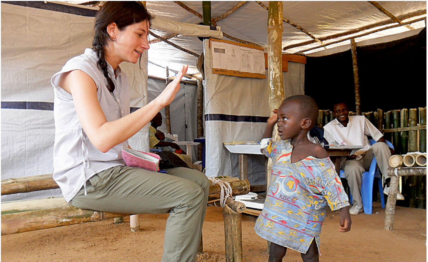
Parte del equipo de trabajo MSF

un color rojizo muy característico de estas tierras africanas. Nuestra base es una de esas construcciones, rehabilitada por MSF como oficinas y habitaciones, está situada frente a la catedral, todas las mañanas a las 5:30AM nos despertaban las campanas y los cantos religiosos.