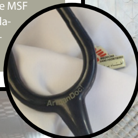
En el hospital de Hawijah