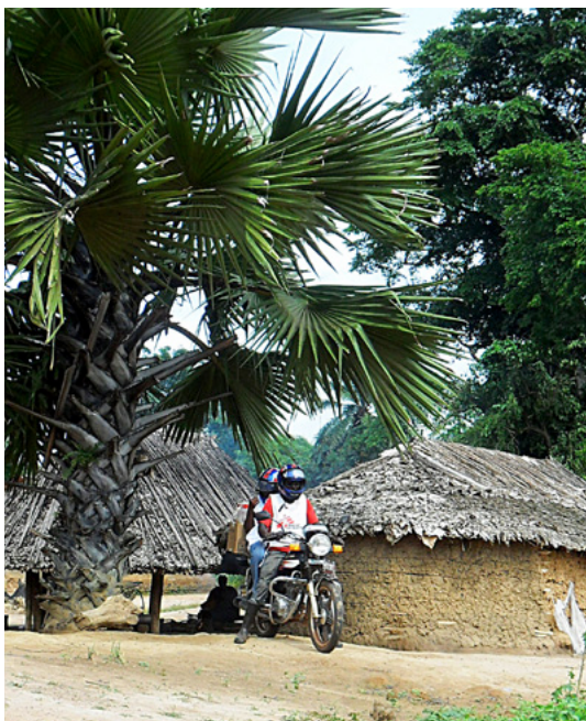
Un tukul y una moto MSF en RDC

“Tres semanas después, volví a armar mis maletas para realizar en otro poblado una evaluación por una posible epidemia de meningitis... pero esa ya es otra historia... intensa y gratificante, como cada misión junto a MSF”