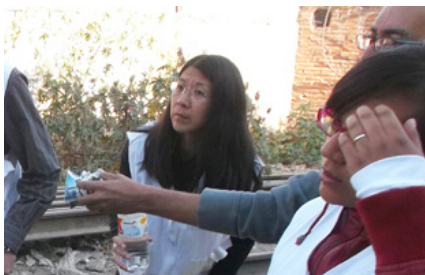
La Dra. Joanne Liu en su visita a México durante 2013