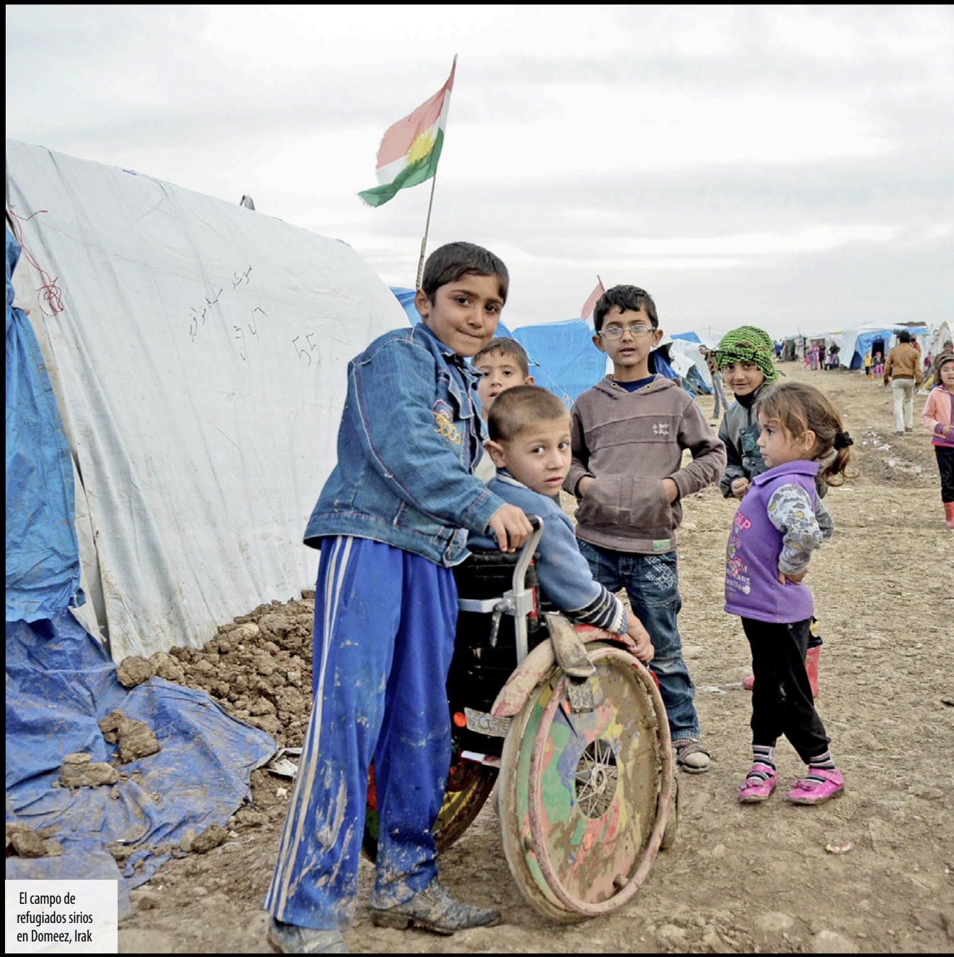
El campo de refugiados sirios en Domeez, Irak

Fotos Armando García Guerrero MÉDICO URGENCIÓLOGO MEXICANO DE MSF