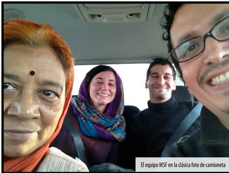
El equipo MSF en la clásica foto de camioneta

Tuvimos oportunidad de trasladarnos al campo de refugiados en Domeez en el norte del país, fronterizo con Siria, para contribuir con los esfuerzos de otros equipos de MSF en la atención primaria a esta población refugiada con muchas necesidades.