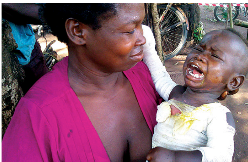
La atención médica pediátrica es una prioridad para MSF en esta región