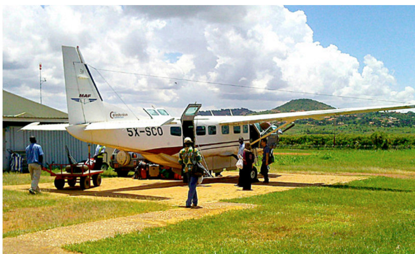
Transporte aéreo en la región