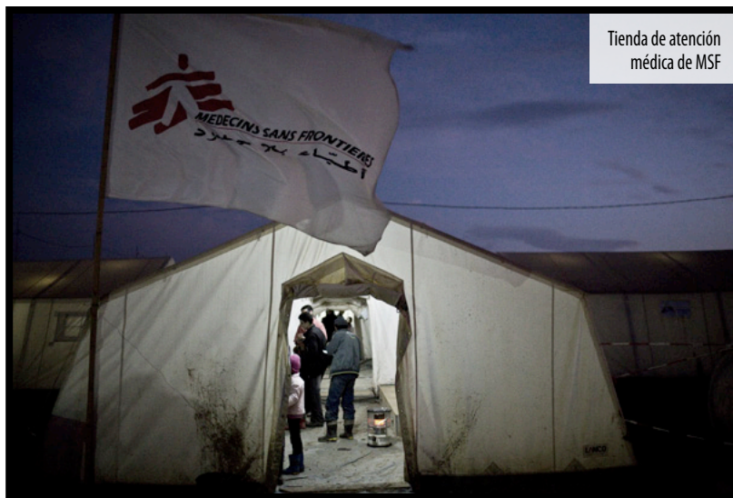
Tienda de atención médica de MSF

Han pasado meses ya desde que emprendí aquel viaje que dio inicio a mi camino médico humanitario. Trabajar con MSF ha sido mi anhelo de vida, un deseo que nació en 2004 cuando me gradué de médico generalista.