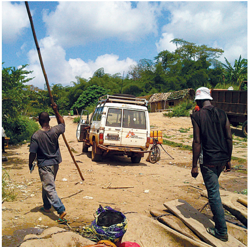
Postal de las condiciones de los caminos en RDC

Fue ahí donde reviví esa sensación de estar en el lugar correcto en el momento correcto, porque además de atender a los pacientes de la epidemia de sarampión, la gente comenzó a llegar de lugares aledaños, y pronto me encontré ayudando al enfermero local a atender a todos los pacientes del centro de salud, niños con malaria, mujeres embarazadas, hombres quemados e incluso tratar, por primera vez, a un bebe con tétanos neonatal, una infección muy rara en nuestra sociedad, pero aun de alta mortalidad en estas zonas rurales.