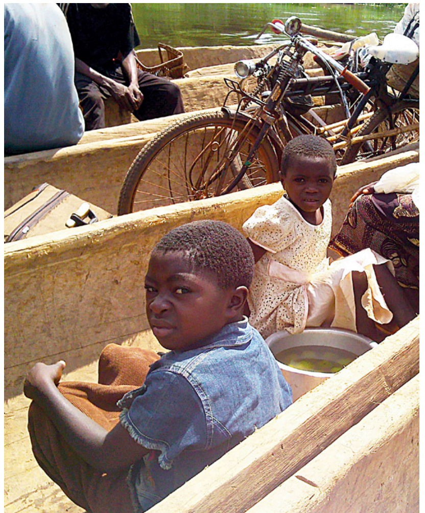
Los jóvenes, uno de los grupos más vulnerables en Congo

En esta edición de Reacción nos comparte sus impresiones en la misión en Congo.