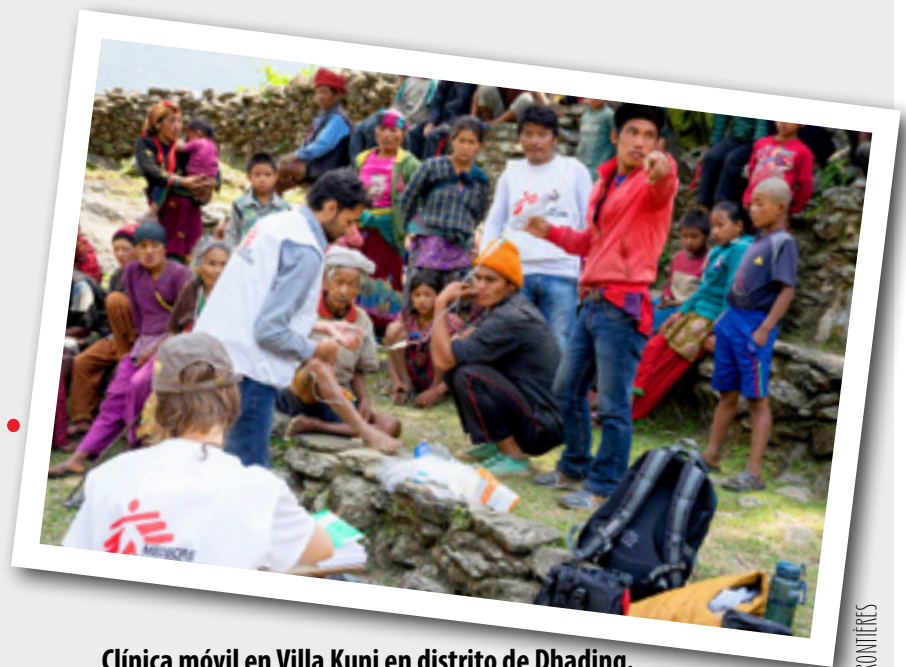
Clínica móvil en Villa Kuni en distrito de Dhading.

GRACIAS a aportaciones regulares de personas como tú al Fondo de Emergencias de Médicos Sin Fronteras, es posible estar preparados y llegar a las poblaciones más remotas en menos 48 horas.