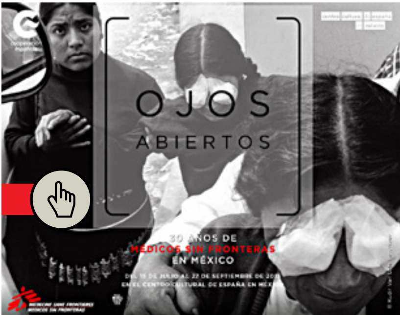
Exposición fotográfica de MSF en el Centro Cultural España en México