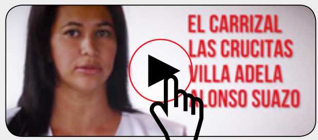
Vídeo: Servicio prioritario: Respuesta médica a la violencia sexual en Honduras